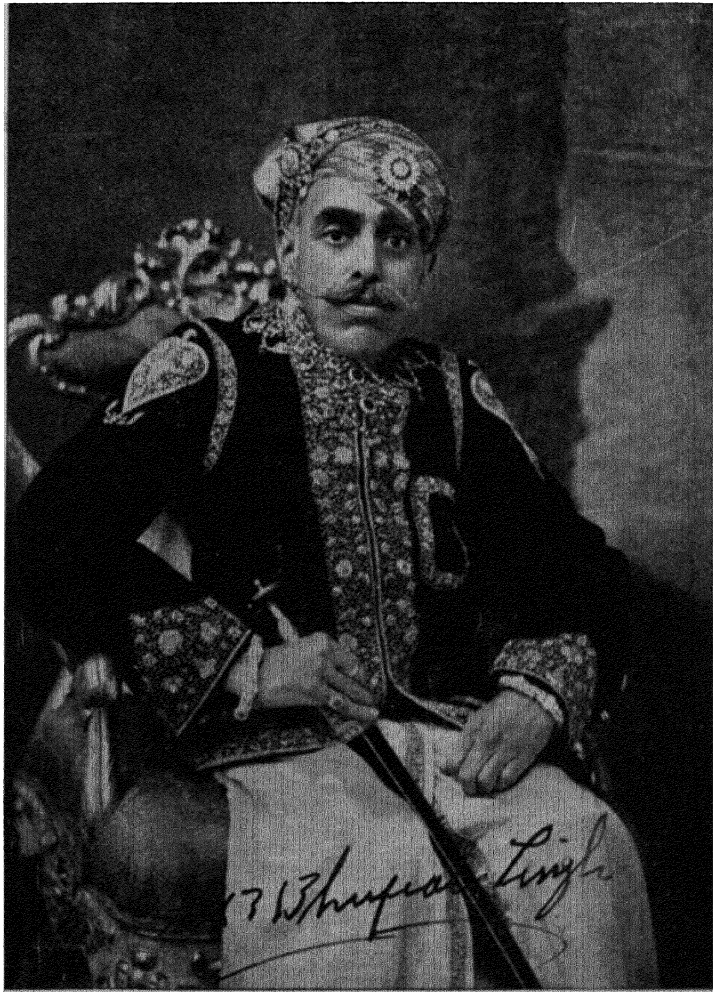
हिन्दू-कुल-शिरोनधि महाराणा भूपालसिंहजी, महाराज-प्रमुख, राजस्थान